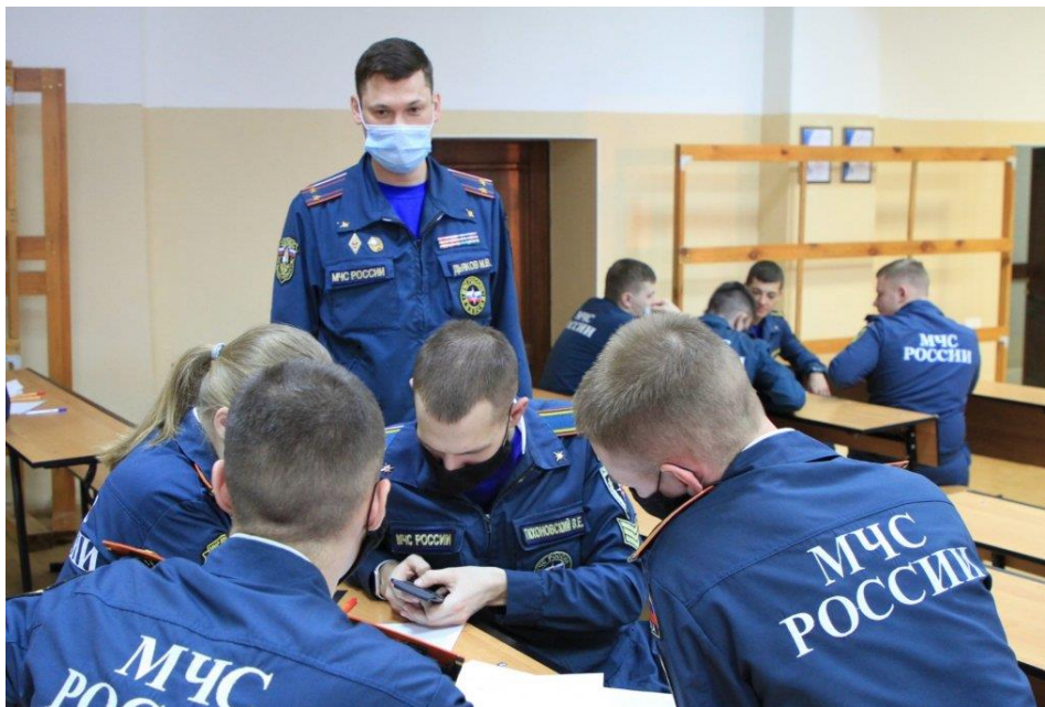
Рис. 1. Теоретические занятия

На практических занятиях (рис. 2) применяются следующие методы – «показные, контрольно-проверочные, учебно-тренировочные занятия, занятия в теплодымокамере, на огневой полосе психологической подготовки, в пожарно-спортивном манеже, на учебном полигоне (объекте)». Эти занятия проводятся для устойчивого обучения общим и специальным навыкам, согласованности действий сотрудников пожарных отделений, дежурных смен, решения общих и специальных задач физической и психологической подготовки.