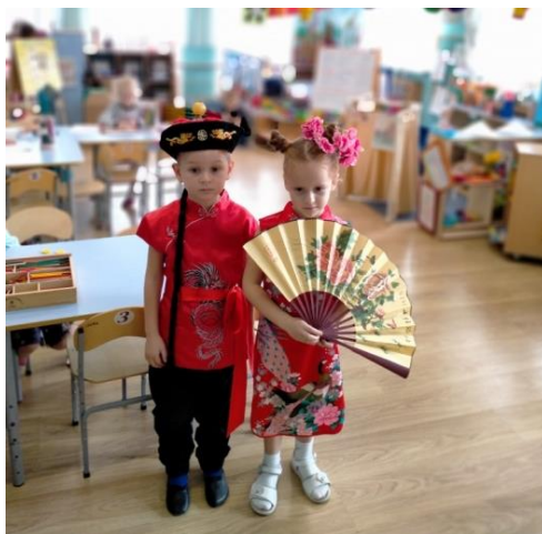
Рис. 2. Дети в китайских костюмах