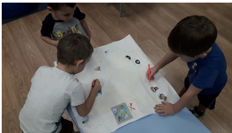
Рис. 1. Изготовление пиратской карты

Но как говорится: «Самое лучшее открытие то, которое ты сделал своими руками...» так вот в этом мы убедились, работая в рамках проектной деятельности. Образовательный проект «Пираты» был создан по инициативе детей. В этом проекте ребятам очень хотелось почувствовать себя в роли настоящих пиратов. Для этого мы создали: карту пиратов, треуголки, клад, сундук для хранения пиратских сокровищ, сабли, пиратские банданы, и непосредственно сокровища.