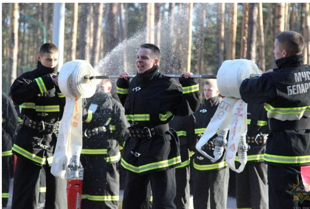
Рис. 3. Состязательные формы занятия

Следующие методы практики (табл. 1) являются наиболее распространенными в данной дисциплине