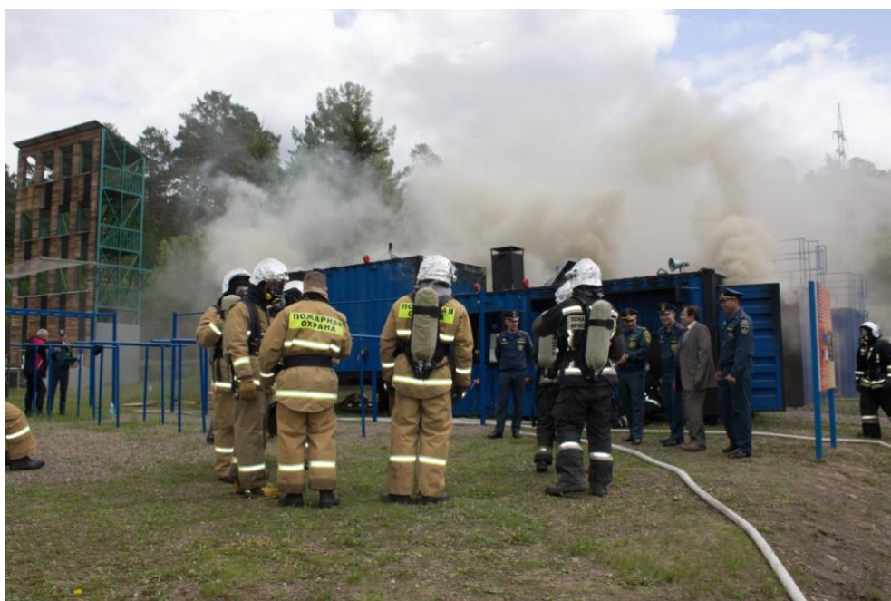
Рис. 2. Практические занятия

На практических занятиях (рис. 2) применяются следующие методы – «показные, контрольно-проверочные, учебно-тренировочные занятия, занятия в теплодымокамере, на огневой полосе психологической подготовки, в пожарно-спортивном манеже, на учебном полигоне (объекте)». Эти занятия проводятся для устойчивого обучения общим и специальным навыкам, согласованности действий сотрудников пожарных отделений, дежурных смен, решения общих и специальных задач физической и психологической подготовки.